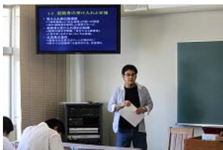
原発事故問題と コミュニティの再生