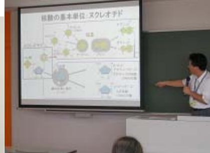
細胞周期とチェックポイント