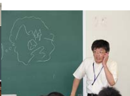
意識と無意識の心理学