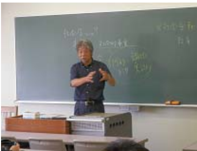
学校教育の社会学 (校則・いじめ・不登校)