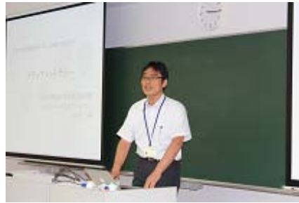
メディアリテラシー