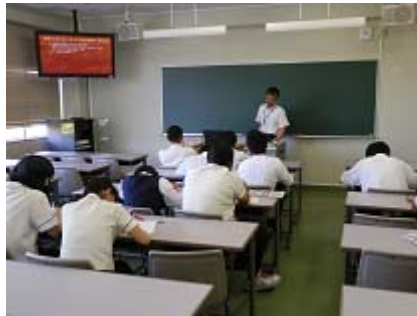
こころを測る ～心理学実験方法入門～