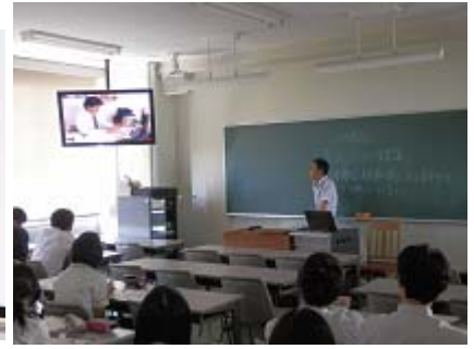
日本アニメの躍進