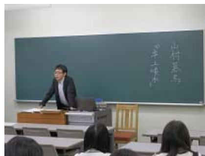
文学を学ぶことと 生き方を学ぶこと